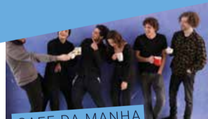
CAFE DA MANHA