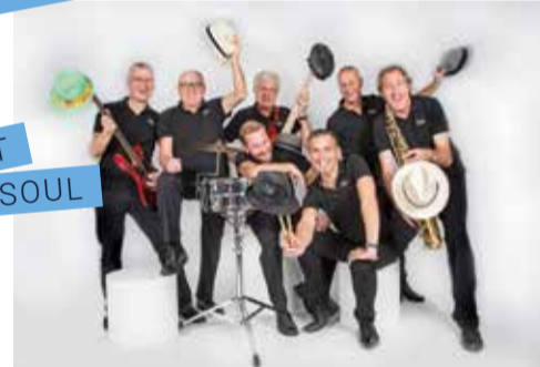
FILET OF SOUL